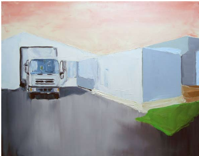
David Lefebvre, PME – Camion , 2007 huile sur toile, 50 x 45 cm

David Lefebvre a choisi de faire de la peinture à l'huile au milieu d'un flot incessant d'images. Il accumule, reproduit, dissèque mais aussi déforme et saccage les images glanées au fil de ses dérives sur Internet, dans des magazines télé ou dans des albums de famille. Sa peinture à l'huile sait tout faire : des paysages bucoliques, des vieux, des PME, des chiens, des trains. Pour BASSE DEF elle saura aussi faire du papier peint.