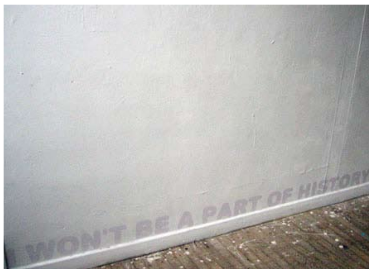
Tolga Taluy, I won't be a part of history lettres adhésives, dimensions variables, 2007

Tolga Taluy observe et décrypte les médias à travers une radicalité paradoxalement nonchalante. Ses travaux esquivent toutes confrontations, mais ils savent surgir là où il faut : comme une force non agressive, mais à l'efficacité réelle et incisive. Pour BASSE DEF, sera entre autre présentée sa vidéo Girls , où, sur des images recyclées, une voix susurre a capella le tube de Cyndi Lauper ( Girls just want to have fun , 1983), et infecte au passage tout l'espace d'exposition de sa délicate nostalgie.