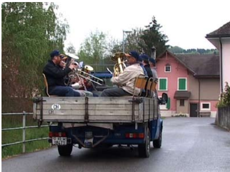
Denis Savary, La Diane , 2004, vidéo, son, couleur, 13'50

Les vidéos et les dessins de Denis Savary fascinent par la simplicité des moyens mis en oeuvre. Rien de spectaculaire et pourtant l'incongruité des actions et des formes suffit à nous faire glisser dans un monde déroutant - il s'agit pourtant de chez nous.