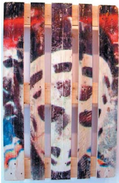
Serge Comte, Imago , 2004, palette de transport Epal®, 120 x 80 x 15 cm

Né en 1966, vit et travaille à Reykjavik http://sergecomte.free.fr/