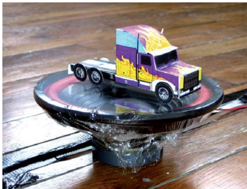
Fabrice Croux, Trucks , 2004, (détail) installation sonore, maquette en papier, dimensions variables

Né en 1977, vit et travaille à Lyon et Grenoble.