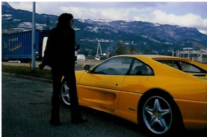
Fanette Muxart, L.V. , «Ready to go», 2005 photographie argentique, 10 x 15 cm extrait d'une série de 25

Née en 1982, vit et travaille à Grenoble.