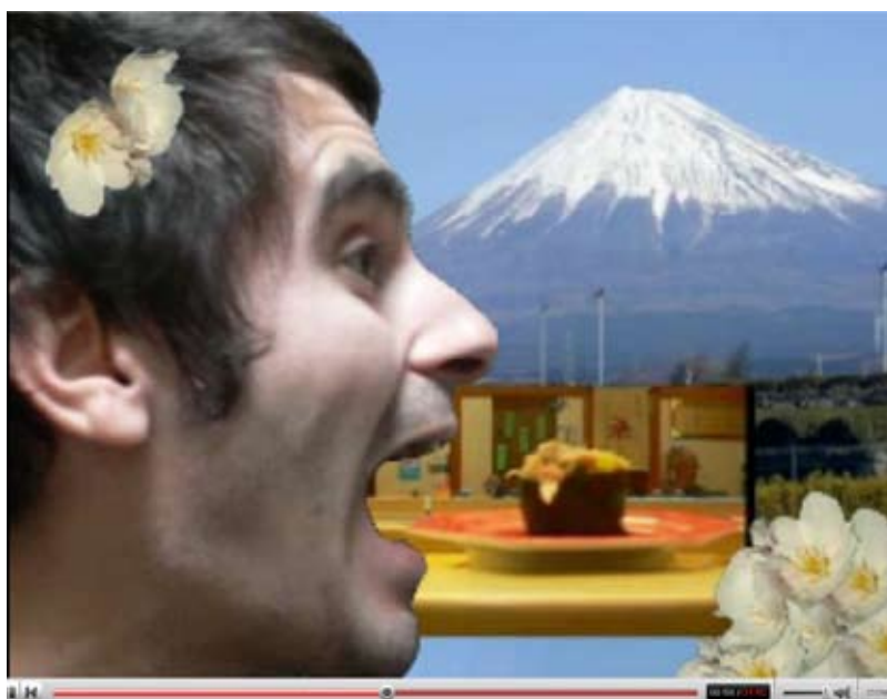
Pierre Lesclauze, Dai Suki ! , 2007, vidéo, couleur, son, 1'50

Une vidéo diffusée en ligne montre un tractopelle avançant avec une précision chirurgicale dans une étroite ruelle Tokyoïte. Les trottoirs sont saturés d'objets et l'engin manœuvre lentement, un peu à droite, un peu à gauche, passera, passera pas... peu à peu, toute la rue est saisie par le lent déplacement de cette énorme machine. La vidéo est le médium privilégié de Pierre Lesclauze : elle lui permet de saisir la fragilité de la banalité, mais aussi les plus énormes clichés touristiques, pour initier de petits sursauts.