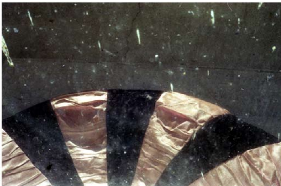
Elodie Lecat, Sans Titre , 2007, photographie couleur, support et dimensions variables

Les images d'Elodie Lecat construisent des moments où le familier bascule dans l'étrange. Une méhari jaune roule à tombeau ouvert. Le soleil se lève caché derrière la nuque d'un homme. Un champs de maïs semble saccagé, brûlé par le soleil, ou par quelque chose d'autre, mais quoi ? ... Des univers brumeux se dessinent. Pour BASSE DEF elle déploie une de ses images comme un poster collé sur le mur d'une pizzeria.