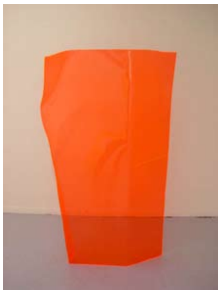
John Armleder, ST from perspex sculpture , 2003, 130 x 60 x 15 cm

Né en 1948, vit et travaille à Genève www.artpublic.ch