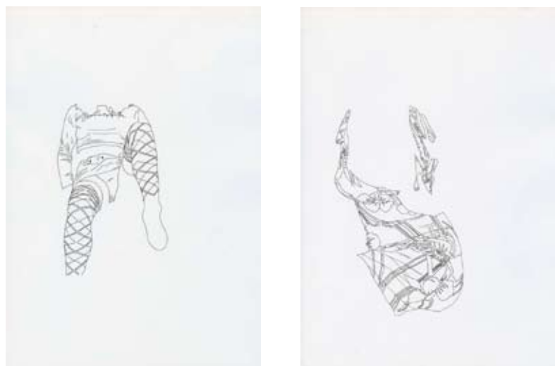
Clôde Couplier, Les armures , série depuis 2006, Rotring sur papier format A4

Le travail de Clôde Couplier n'est défini par aucun médium particulier, néanmoins, une certaine économie de moyens sous-tend toute sa production.