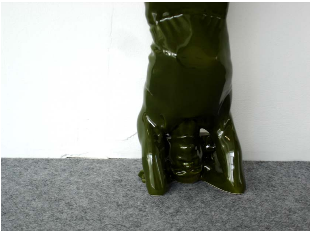
Xavier Veilhan, Yogi (vert) , 2006 (détail)