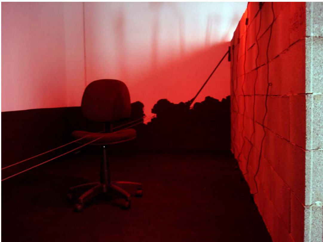
Olivier Nottellet, La synchronisation du monde des affaires , 2008 (détail de l'installation)