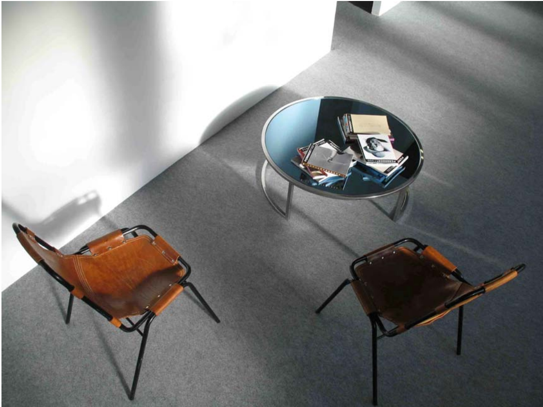
Permanent Food de Maurizio Cattelan ; Chaises atelier Charlotte Perriand, 1977 Table basse Roche Bobois, 1970