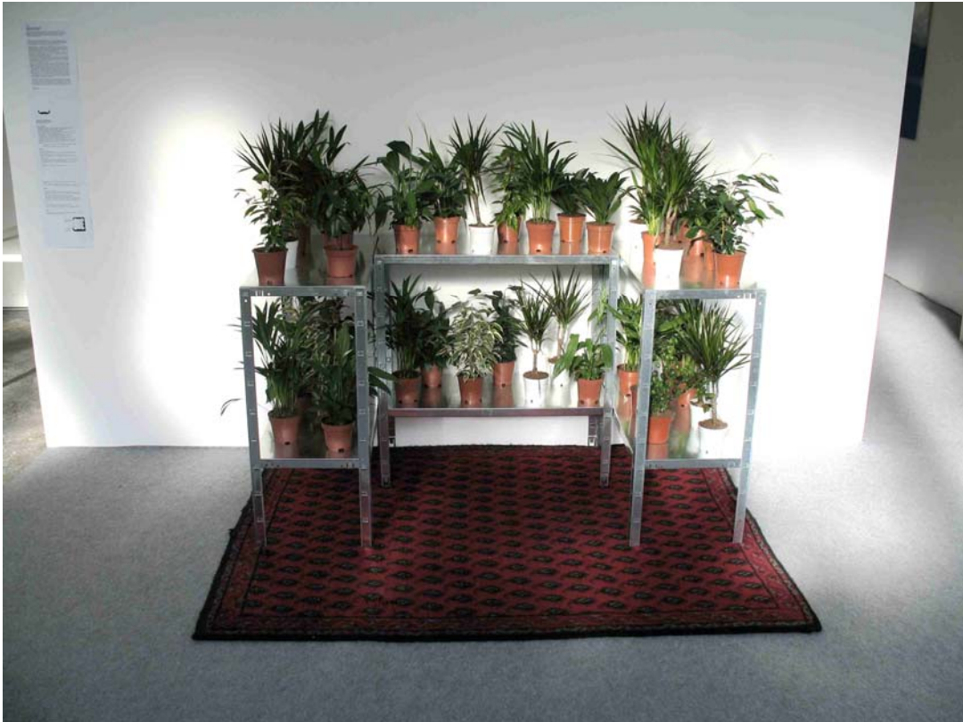
Alexandre Ouairy, L'assemblée végétale , 2008