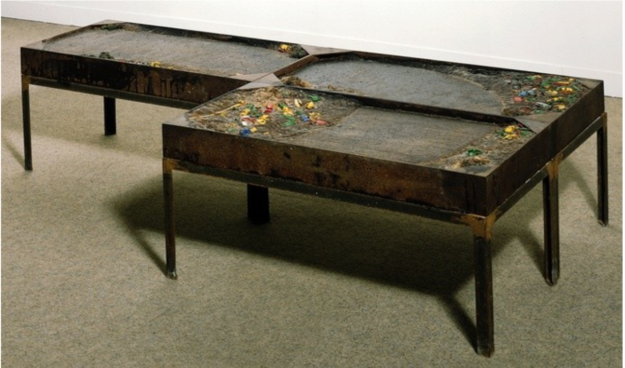
Dieter Roth, Am Rhein , 1970, Trois bacs sur piètements métalliques contenant, noyés dans du sucre, des éléments divers en plastique et métal, fer, sucre glace amalgamé, plastique, métal, 48 x 180 x 90 cm, collection du MNAM