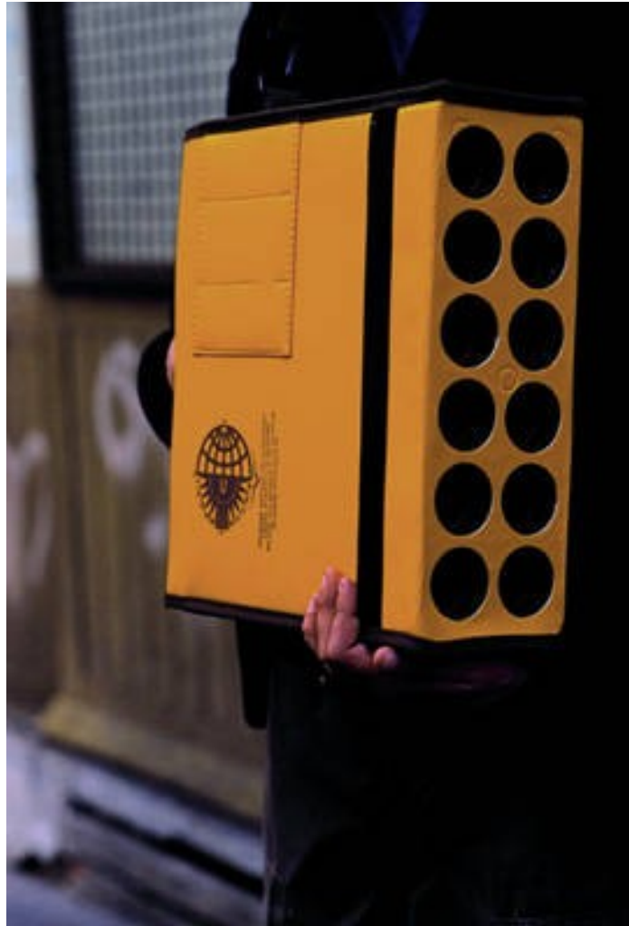
Philippe Meste, Bagpower III , 1999, Technique mixte, 30 x 35 x 12 cm, courtesy Galerie Jousse Entreprise