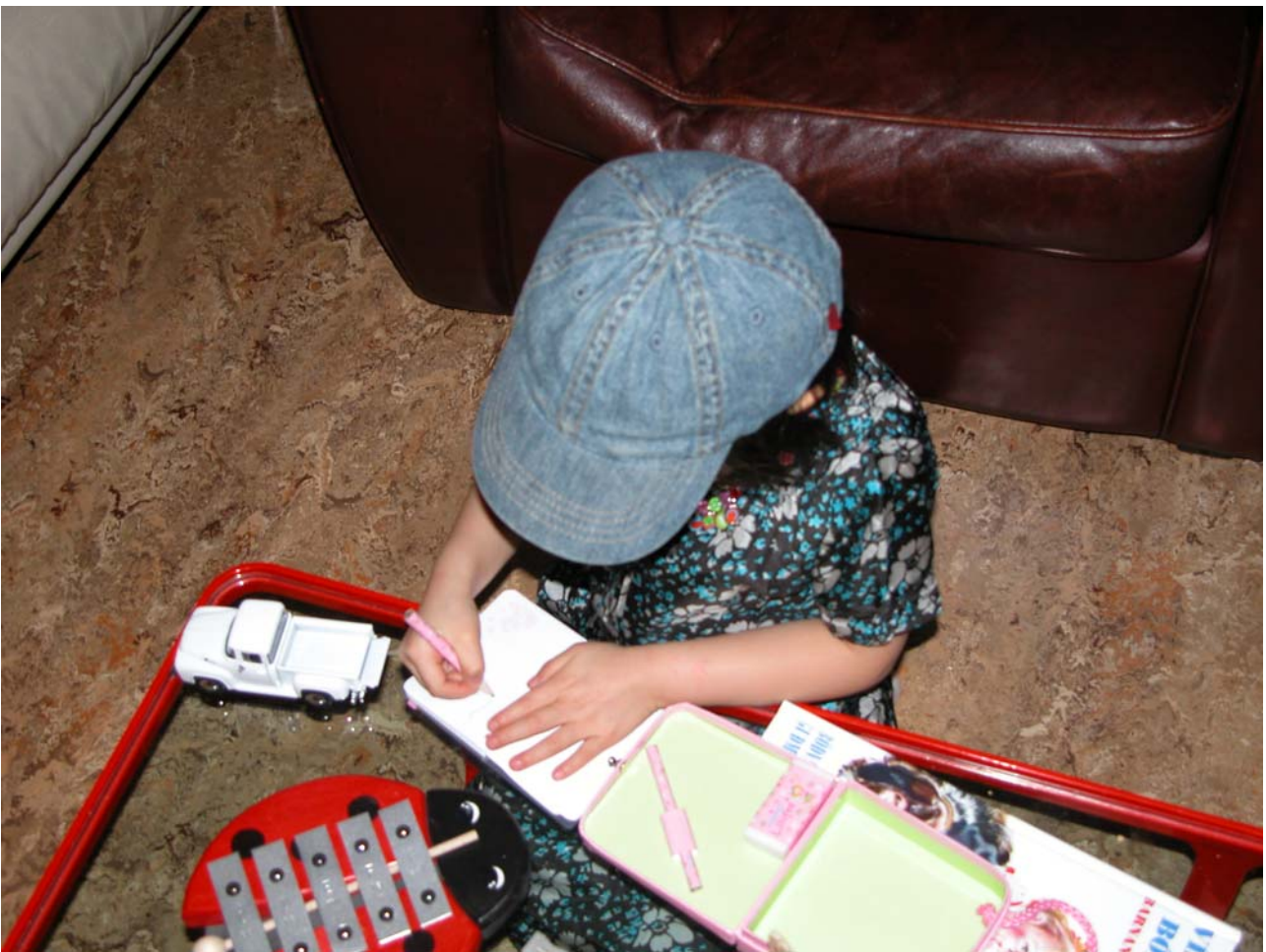
FxC, l'artiste au travail (production d'une série de dessins)

FxC est une artiste multimédia qui utilise les nouvelles technologies, comme son nom pourrait l'indiquer, mais qui n'a pas peur de définir le crayon de couleur ou le feutre parfumé comme l'un des meilleurs substituts de l'effet spécial. La danse, la musique font partie de son arc multi-cordes. qui ne cherche jamais à taper dans le mille mais dans les cœurs sans âme. Déteste détester.