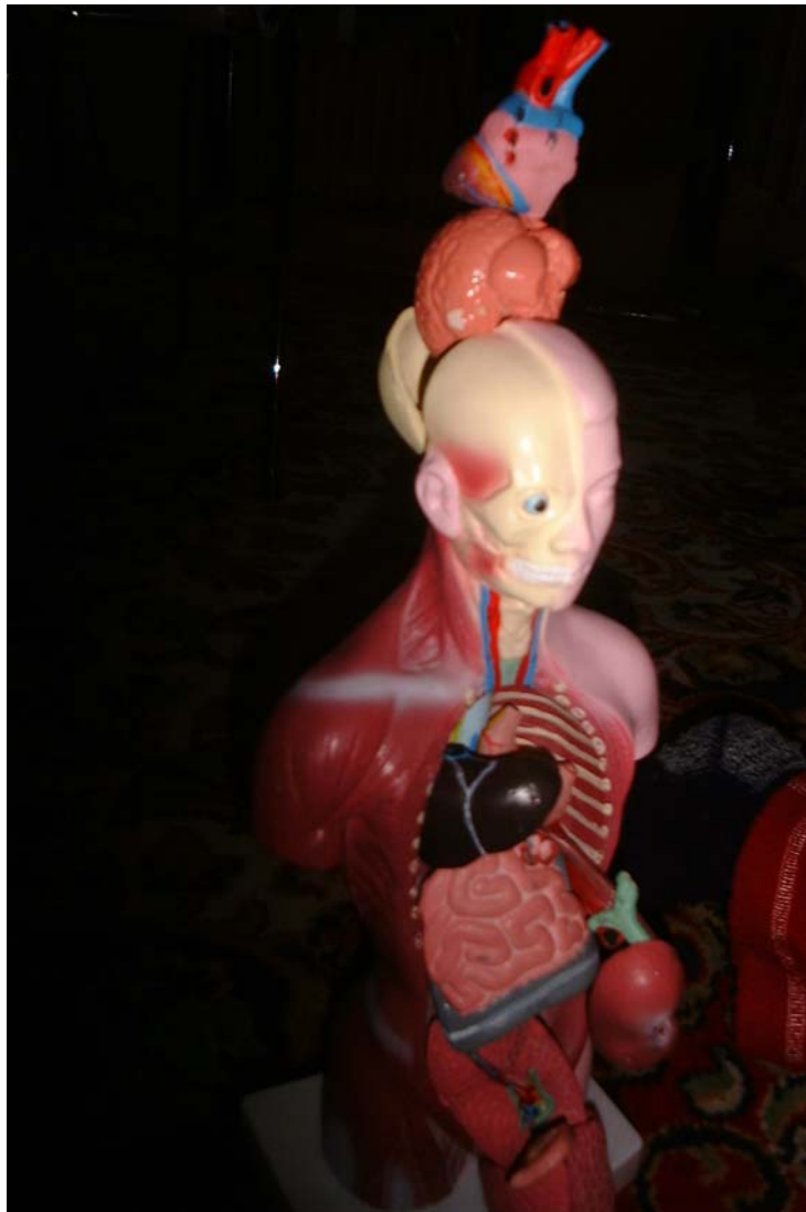
Þór Þór Þór, Sans titre, 2007, sculpture en résine.

Þór Þór Þór : trois fois le nom du dieu scandinave de la foudre (Thor), pour n'avoir pas peur de mettre sa tête entre le marteau et l'enclume. Ce n'est pas la peine de dire que sa production est explosive comme la foudre, déchire comme la poudre, : il sait aussi être sage et bien poli. Né en Norvège, dans le fjord de Bergen, ou est mort Keiko, l'orque qui joua autrefois Willy dans "Sauvez Willy", Þór Þór Þór a une attirance pour les performances risquées ; et les mammifères marins.