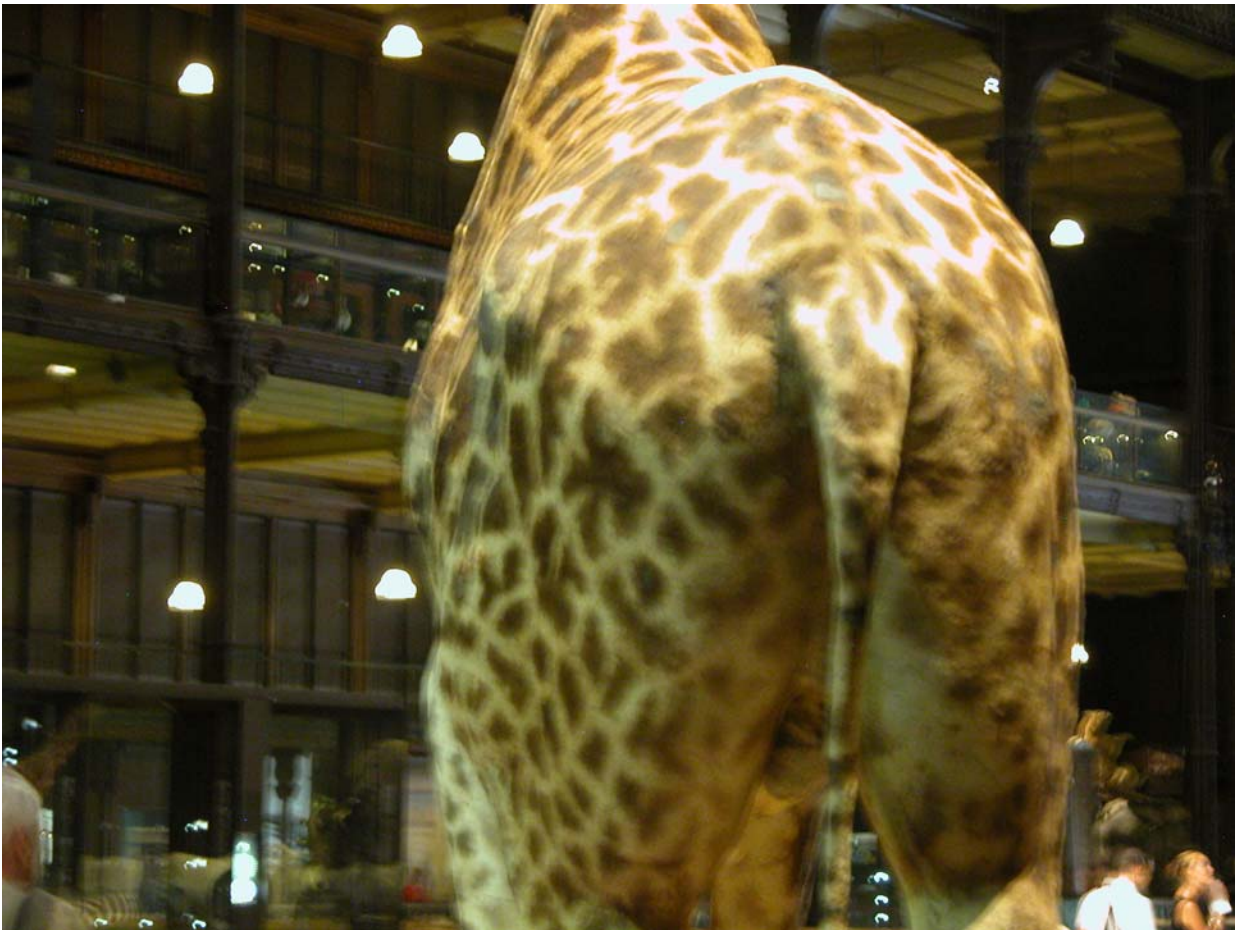
Oktopuce, Les fesses des animaux , 2007, photographie couleur

Oktopuce : la sagesse face à la violence, Ordre copain de Chaos, le respect parfumé à une odeur de pet, artiste qui aime les confrontations pures et du coup fractionne le temps et les habitudes déjà prises en ce début de millénaire. Un homme pré-post-historique, qui taille dans la pierre une nouvelle pensée faite de folie cristalline et de douceur animale. Oktopuce fait un collier avec ses dents de lait pour sa mère.