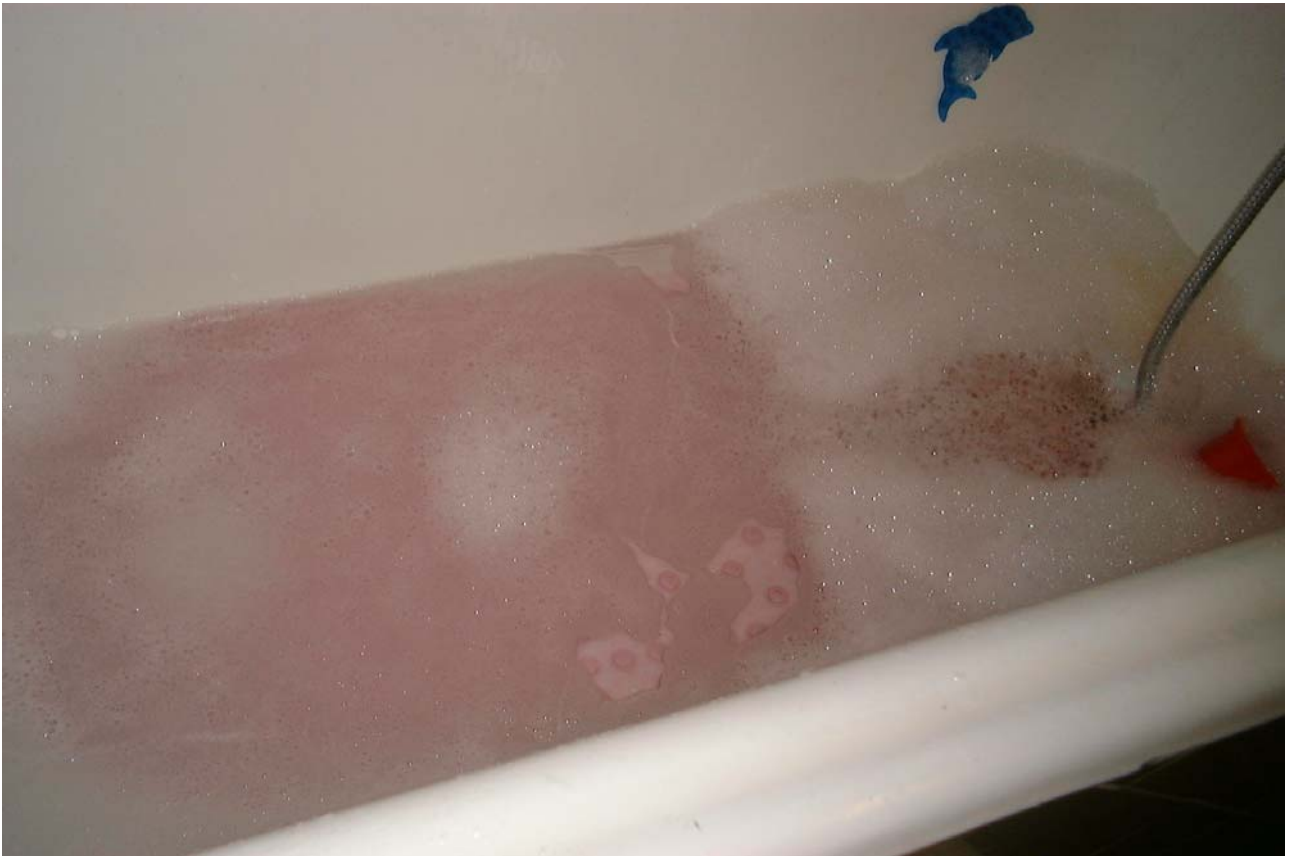
Valgerour Salome, Le bain du père Noël , 2007, photographie, support et dimensions variables.

Valgerður Salome se préoccupe beaucoup de son corps, c'est une fille sensible et réservée, elle développe un travail autour du corps mais qui s'oriente souvent sur l'infiniment petit, le nano-intime. Sa technique à elle est de rendre encore plus minuscule le micron pour aller jusqu'à l'invisible, disparaître pour finalement être encore plus grande que l'immensité. Valgerður Salome dit souvent que l'Islande est aussi un peu elle-même.