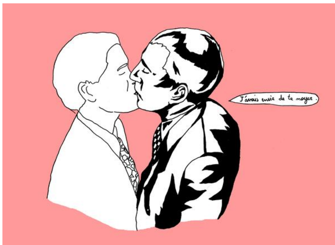
Emilie Besse, Oh oui , 2007