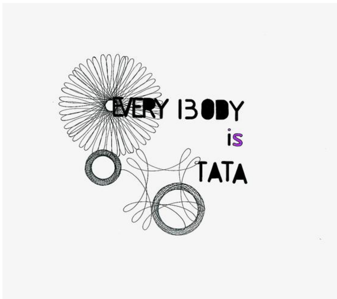
Graphic Industry , Every body is tata , 2007, Encre sur papier A4