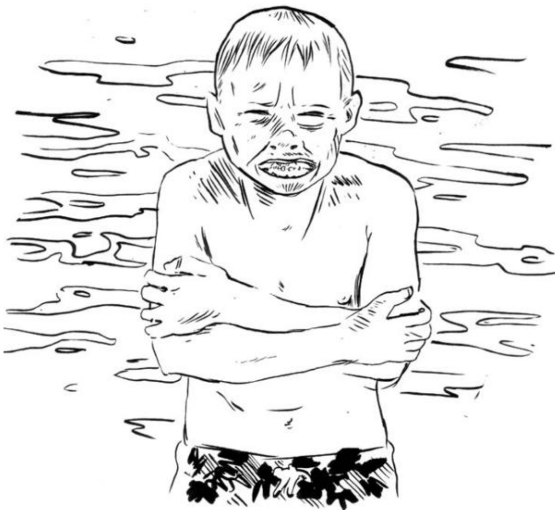
Eric Férès, Le petit qui a froid , 2007, Encre sur papier A4